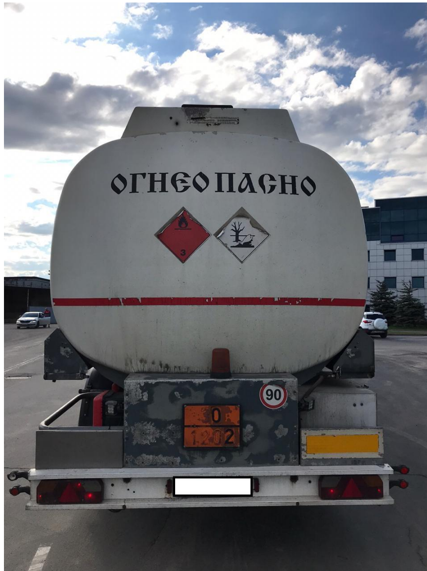
Рисунок 2 – Общий вид полуприцепа-цистерны LAG

Схема пломбировки для защиты от несанкционированного изменения положения уровня налива, обозначение места нанесения знака поверки представлены на рисунке 3.