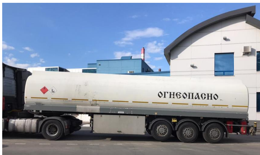
Рисунок 1 – Общий вид полуприцепа-цистерны LAG

Общий вид полуприцепа-цистерны LAG зав. № YB4L0223400006652 представлен на рисунках 1-2.