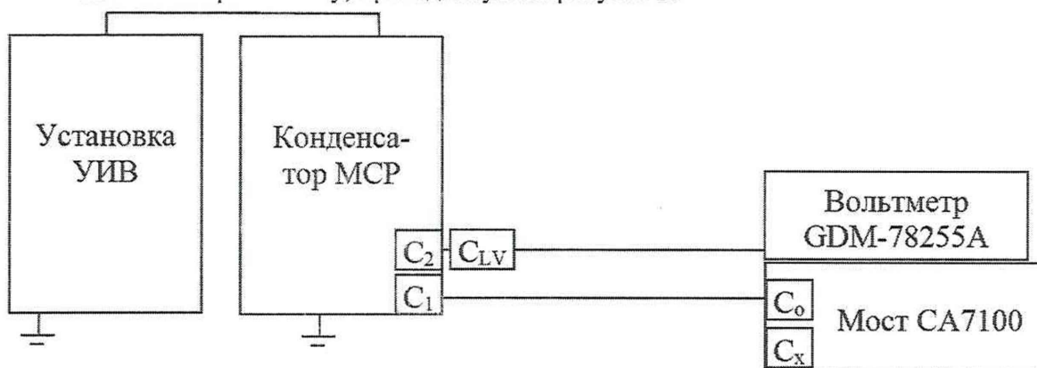
Рисунок 5 - Схема проверки линейности при измерении коэффициента масштабного преобразования напряжения переменного тока

8.5.2.2 Соберите схему, приведенную на рисунке 5.