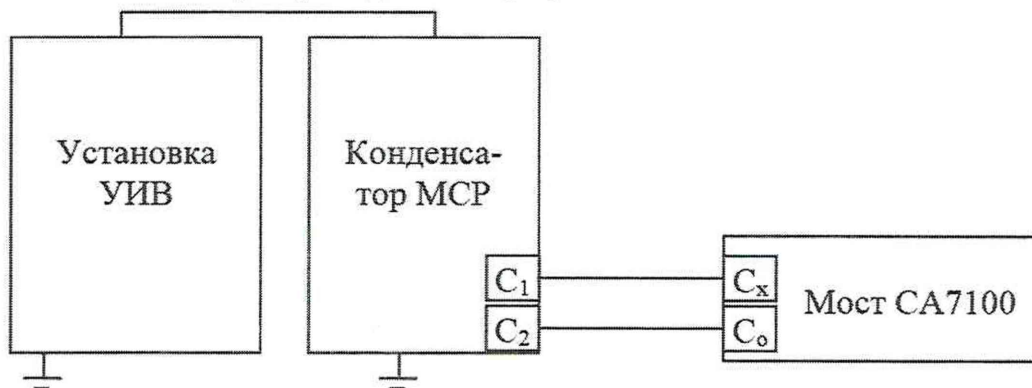
Рисунок 2 - Схема измерений электрической емкости

8.3.2 Включите приборы и дайте им прогреться.