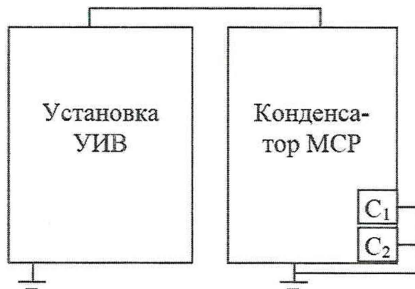
Рисунок 1 - Схема проверки электрической прочности

8.2.2 Сигнальные выводы конденсатора должны быть закорочены на корпус, соединённый с шиной заземления.