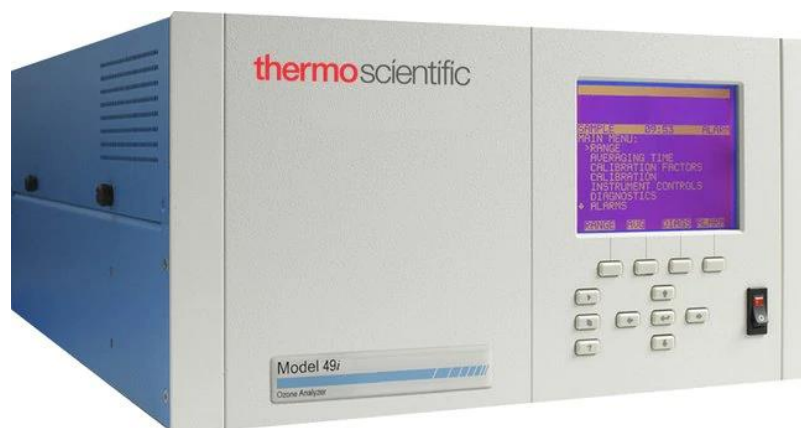
Рисунок 1 – Общий вид газоанализатора 49i (лицевая панель)

Нанесение знака поверки на газоанализаторы не предусмотрено. Знак поверки наносится на свидетельство о поверке.