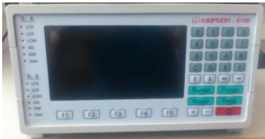
Рисунок 1 - Фотография общего вида тестера цифровых линий универсального "МОРИОН-Е100" (вид спереди)

Конструктивно тестер выполнен в пластмассовом корпусе. Внешний вид тестера цифровых линий универсального "МОРИОН-Е100" приведен на рисунке 1. Схема пломбировки от несанкционированного доступа и место размещения знака утверждения типа приведены на рисунке 2.