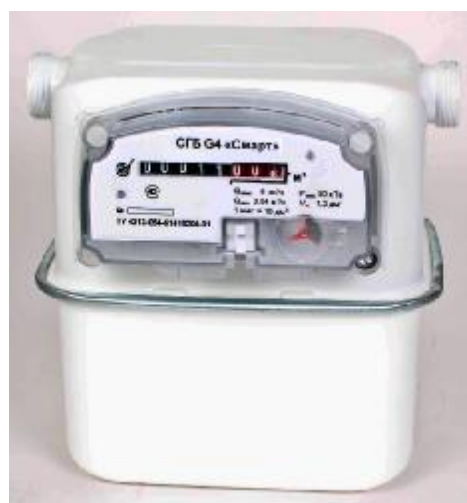
Рисунок 1 - Общий вид счетчика газа бытового СГБ G4 СИГНАЛ (левый, вертикальный, М33х1,5) и СГБ «Смарт» G4-1 (левый, горизонтальный, М33х1,5)