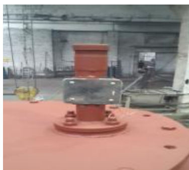
Рисунок 2 - Схема пломбирования РСХН