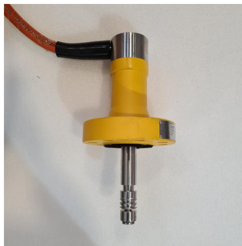
Рисунок 3- Общий вид датчиков модели AA1536710