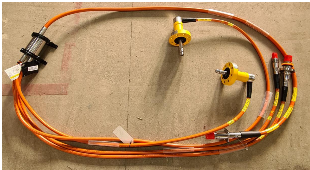
Рисунок 1- Общий вид датчиков температуры и давления комбинированных WEPS-124

Внешний вид датчиков приведен на рисунках 1-3.