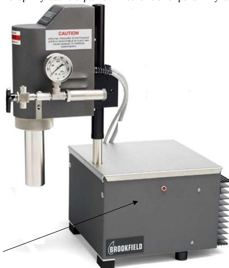
Рисунок 1 - Внешний вид реометра

Фотография внешнего вида реометра представлена на рисунке 1. Место нанесения знака поверки указано стрелкой. Место пломбирования указано стрелкой на рисунке 2.