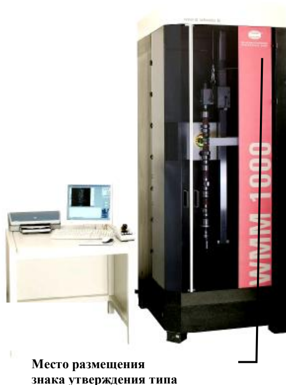
Рисунок 2. Общий вид машин измерительных оптических для контроля валов модификаций WMM 300, WMM 450, WMM 600, WMM 600/400, WMM 1000, WMM 1000/400, WMM 1200

Дополнительная комплектация: модуль программного обеспечения BestFit 2D триггерный контактный датчик, сканирующий контактный датчик, магазин для смены щупов, система пневматической фиксации объекта измерения, четырехкулачковый патрон, шестикулачковый патрон, цанговый зажим.