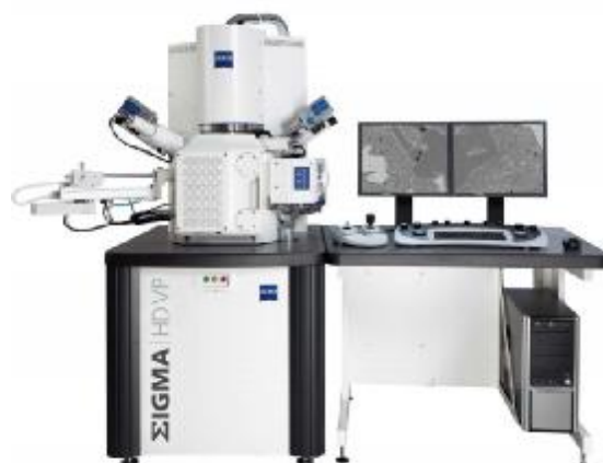
Рисунок 1 – Общий вид микроскопов полевых эмиссионных растровых электронных SIGMA, SIGMA VP, SIGMA HD, SIGMA HD VP