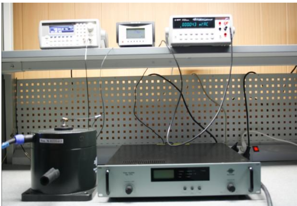
Рис. 1 Внешний вид виброустановки