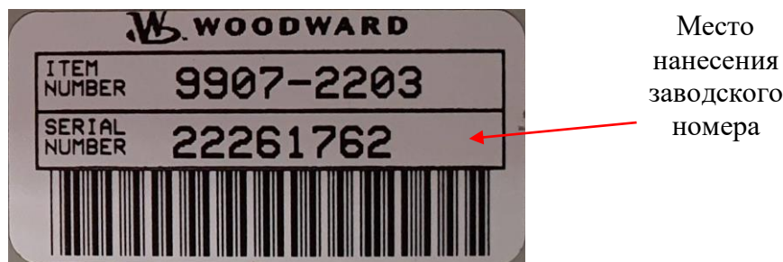
Рисунок 2- Место нанесения заводского номера

Пломбирование датчика не предусмотрено. Заводской номер наносится на датчик методом наклеивания.