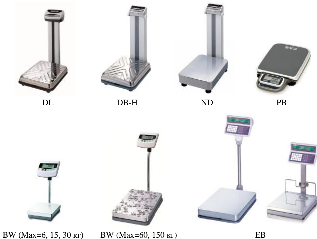
Рисунок 1 - Общий вид весов

Общий вид весов представлен на рисунке 1.