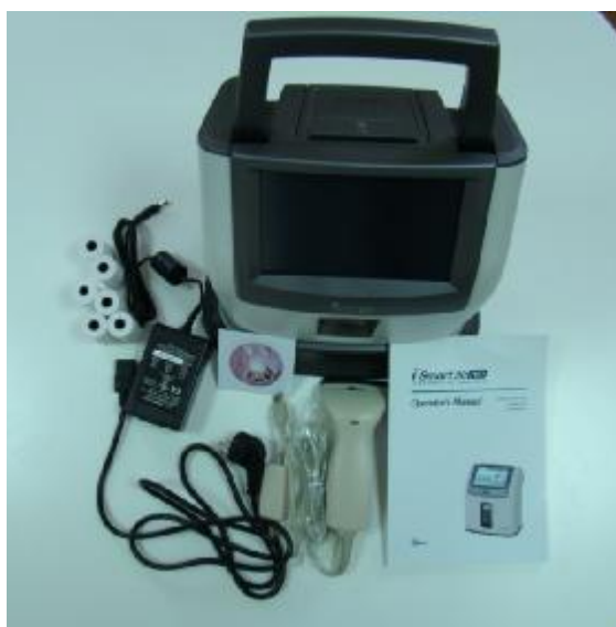
Рисунок 1 – Анализатор электролитов i-Smart 30 PRO.

Анализаторы оснащены серийным портом (разъем RS-232), USB-портом, портом локальной сети LAN (RJ45 Ethernet) для передачи информации на ПК.