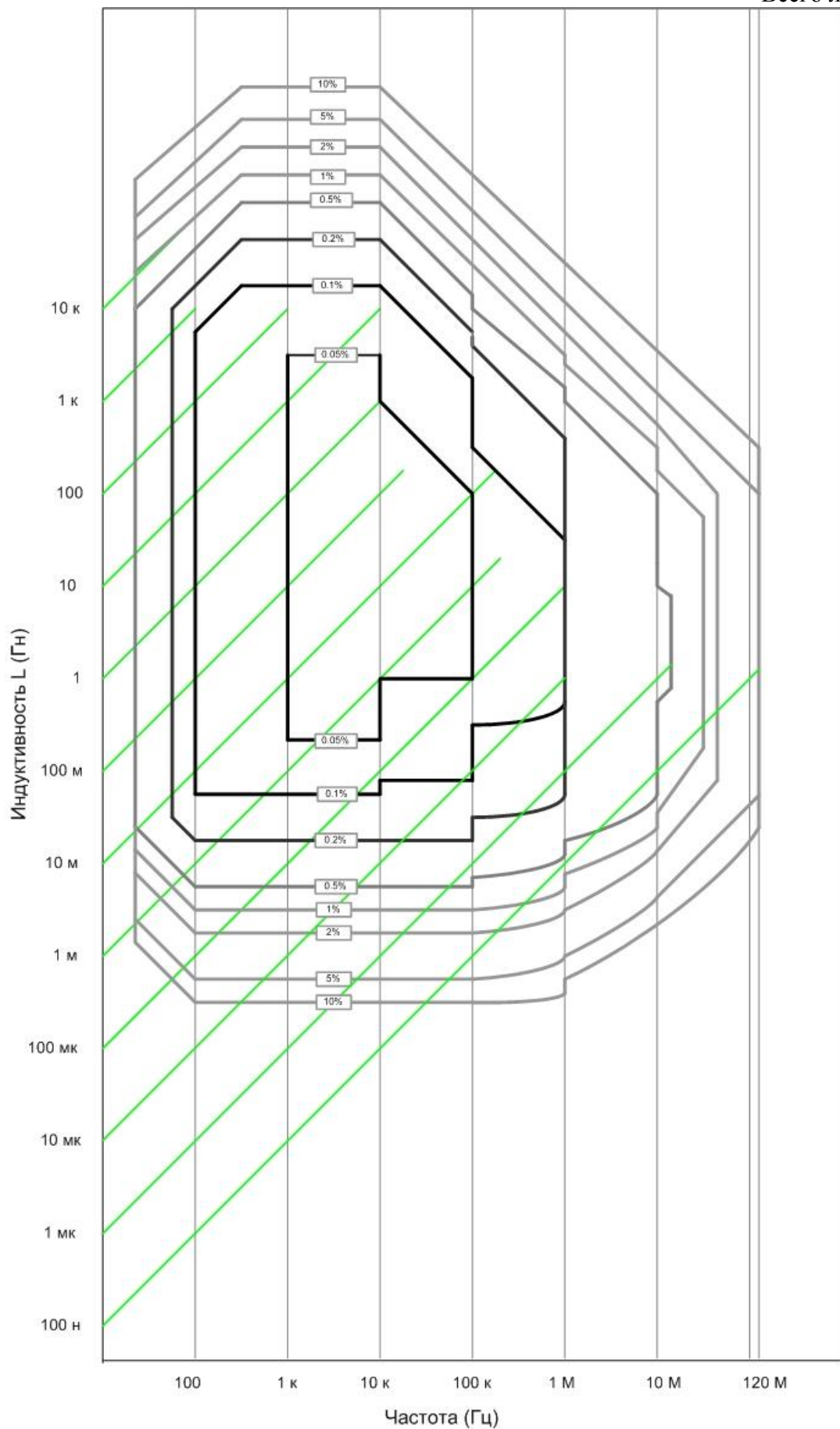
Рисунок 3. График зависимости погрешности (от 0,05 до 10) % измерения индуктивности от номинального значения и частоты