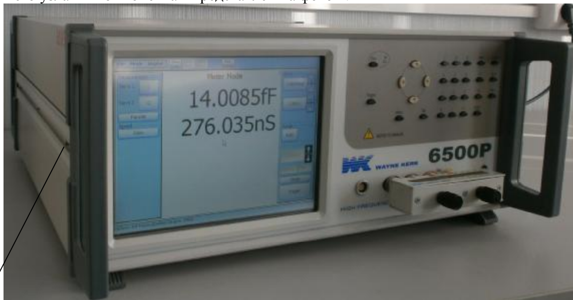
1 – место пломбировки от несанкционированного доступа

Общий вид анализатора с указанием места пломбирования от несанкционированного доступа к его узлам и компонентам представлен на фото 1.