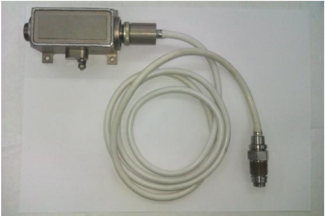
Рисунок 1 - Общий вид датчика ДСЕ 122