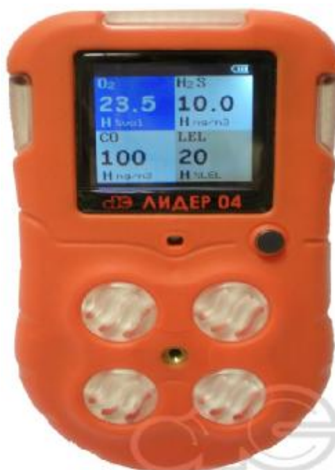
Рисунок 4 – Внешний вид газоанализаторов модели Лидер 04