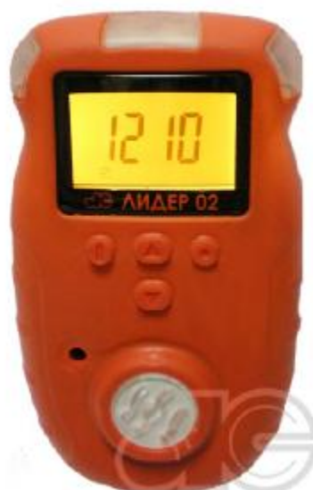
Рисунок 2 – Внешний вид газоанализаторов модели Лидер 02