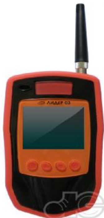
Риснок 3 – Внешний вид газоанализаторов модели Лидер 03