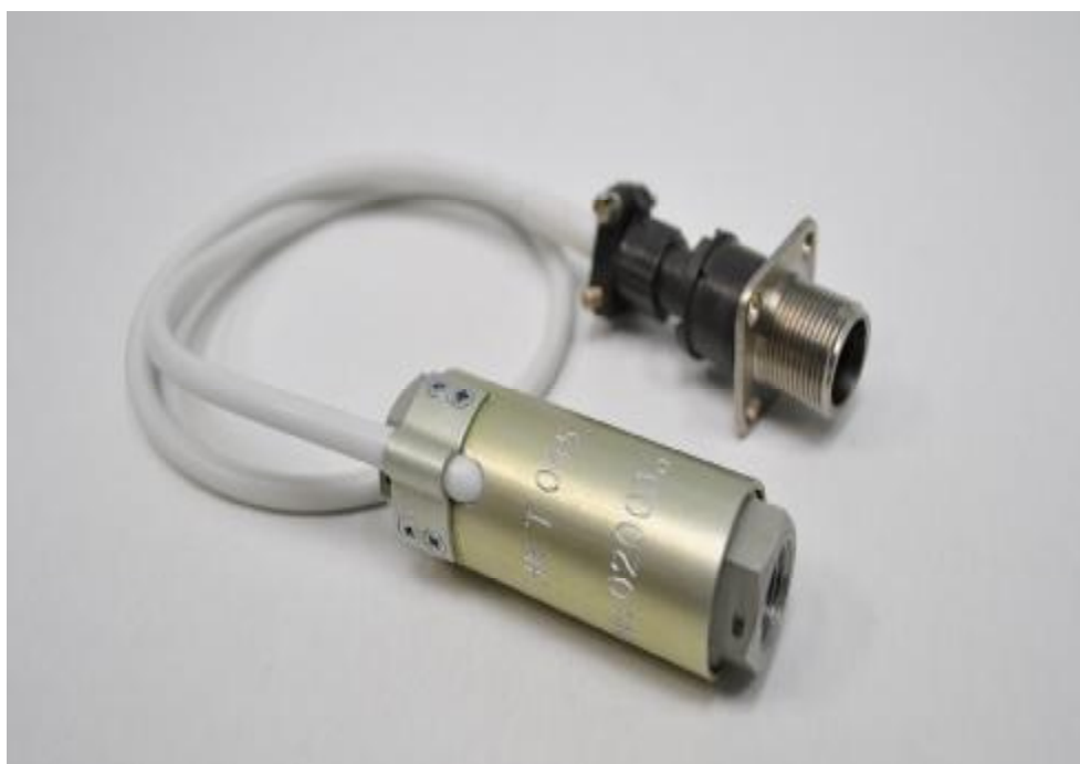
Рисунок 1 - Общий вид датчика силы НЕТ 045

Общий вид датчика силы НЕТ 045 приведен на рисунке 1, габаритные и установочные размеры – на рисунке 2.