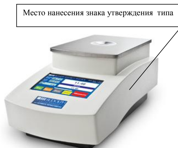
Рисунок 1 – Общий вид рефрактометров автоматических цифровых модели J 47

Конструктивно рефрактометры выполнены в моноблочном настольном стационарном исполнении. Рефрактометры имеют встроенный модуль термостатирования измеряемой жидкости, основанный на элементах Пельтье. В рефрактометрах предусмотрена возможность выполнять измерения при температуре, заданной оператором. Также данные приборы позволяют пользователю выбирать между измерением показателя преломления или измерением градусов Brix (измерение по сахарозе).