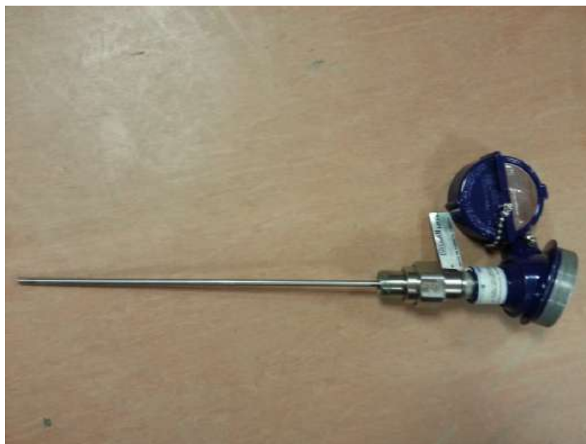
Рис.2. Фотография общего вида термопреобразователя.