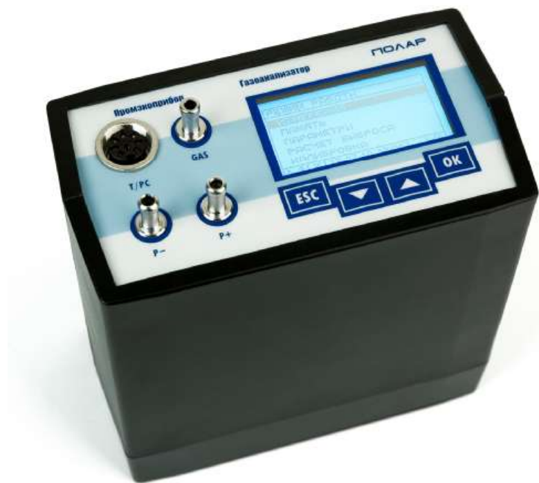
Рисунок 1 – Внешний вид газоанализаторов