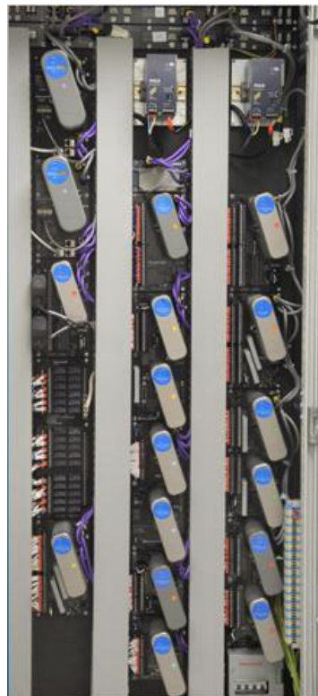
Рисунок 2 – Фотография общего вида системы с модулями ввода-вывода серии 8