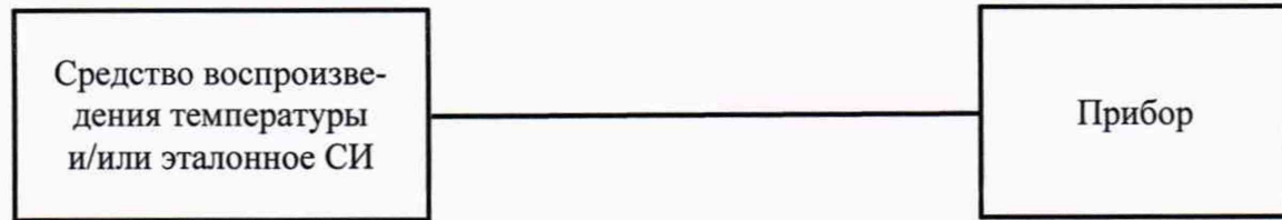
Рисунок А.2 – Схема проверки прибора при измерении температуры (для модификации ТМР)