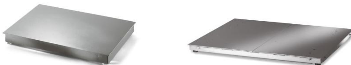
iL Professional 800F/MP