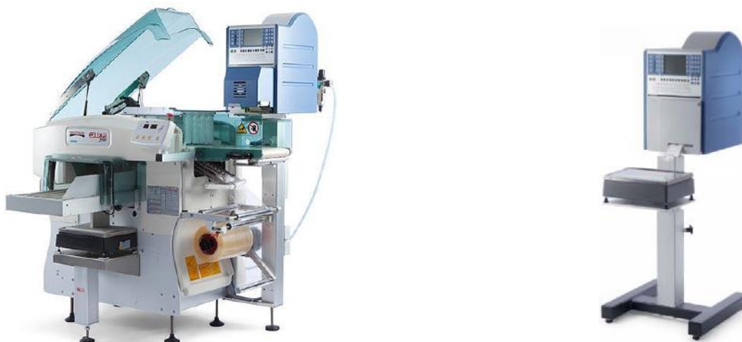
Рисунок 2 — Весы GLM-E Automac LA 18 A/M в составе упаковочной машины (слева); весы GLP-WI с ГПУ LA 18 A/M на стойке (справа)