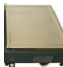
LA 18 A/M