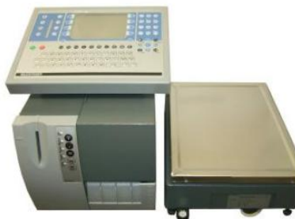
Рисунок 1 — Весы GLP-W (принтер GLP 80, терминал GT 6M, ГПУ LA 18 A/M)

Примеры общего вида ГПУ весов представлен на рисунках 4 и 5.