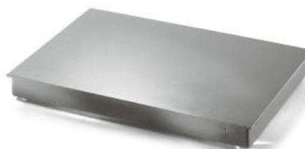
iL Economy 2000F/MP iL Economy 4000F/MP