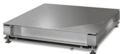
iL Professional 20000F/MP