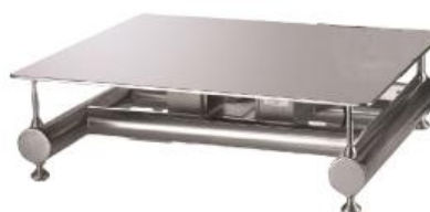
iL Professional 50SMP/SP, iL Professional 150SMP/SP