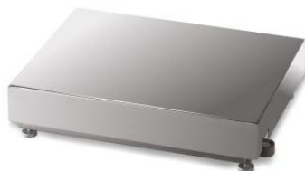
iL Professional 20F/HY, iL Professional 150F/HY, iL Professional 350F/HY, iL Professional 750F/HY