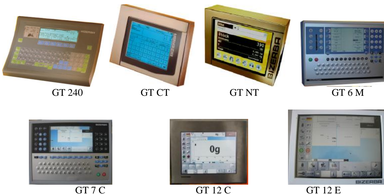
Рисунок 3 — Общий вид терминалов