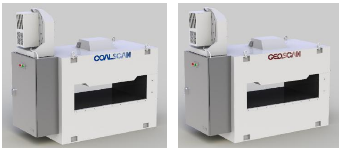
Рисунок 1 - Устройство и общий вид комплексов ОВА Mk IV