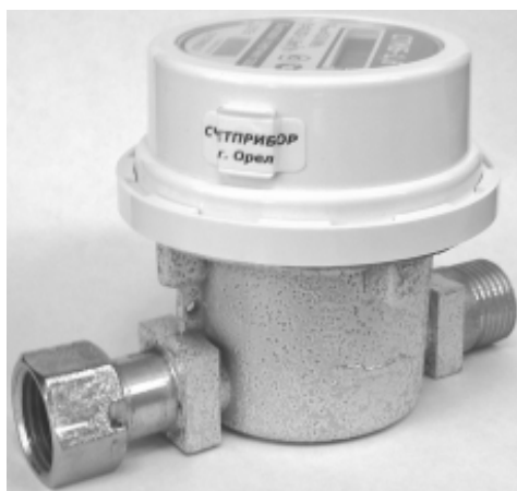
Рисунок 1 – Общий вид счетчиков

Схема пломбировки счетчиков приведена на рисунке 2.