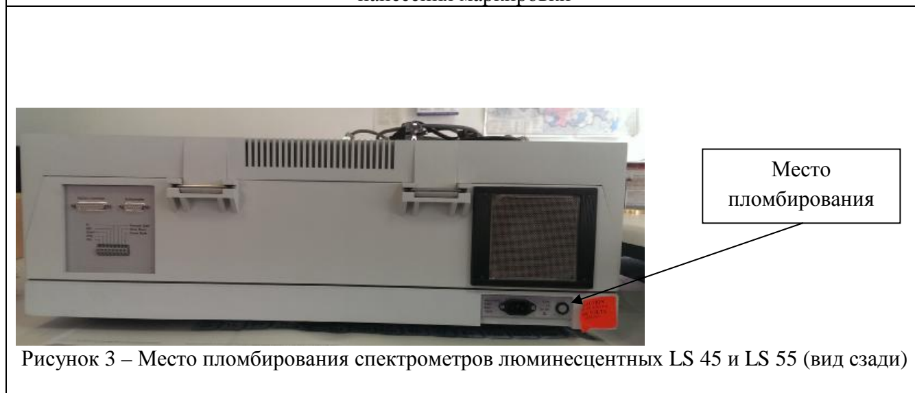
Рисунок 3 – Место пломбирования спектрометров люминесцентных LS 45 и LS 55 (вид сзади)