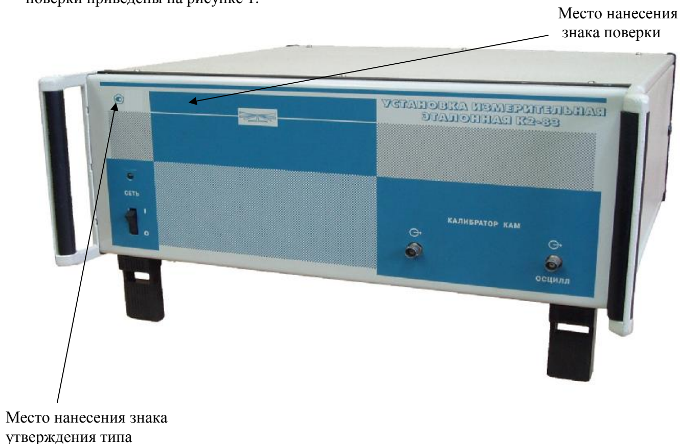
Рисунок 1 – Внешний вид установки

Внешний вид установки, места нанесения наклейки «Знак утверждения типа» и знака поверки приведены на рисунке 1.