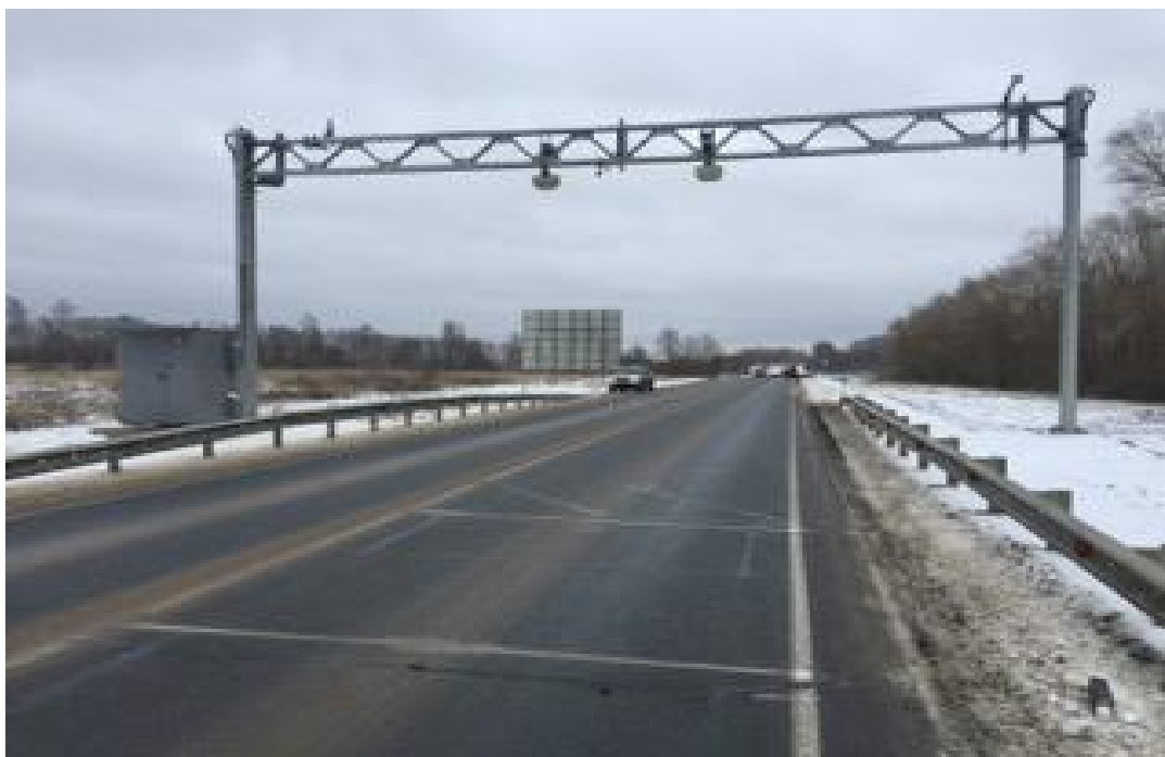
Рисунок 1 – Общий вид системы «ИБС ВИМ»