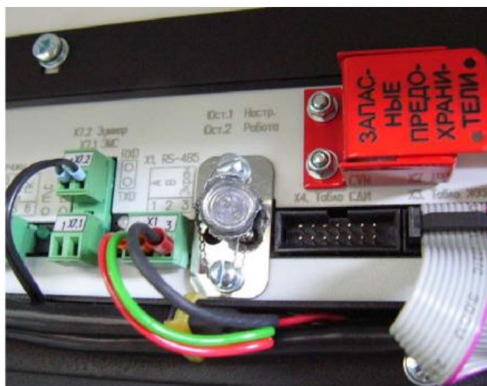
Рисунок 2 – Пломбировка блока управления