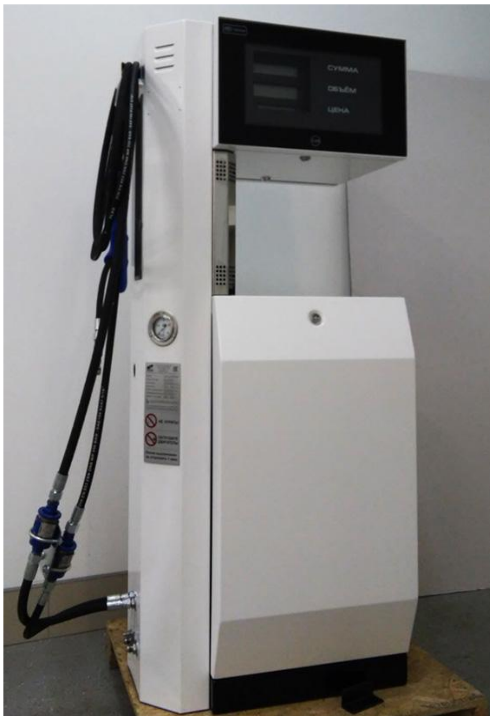
Рисунок 1 – Внешний вид колонки

Внешний вид колонки приведен на рисунке 1. Место пломбирования в целях предотвращения несанкционированной настройки и вмешательства показано на рисунке 2 (пломбируется блок управления, расположенный под крышкой дисплея). Знак поверки в виде голографической наклейки наносится на поверхность крышки дисплея.