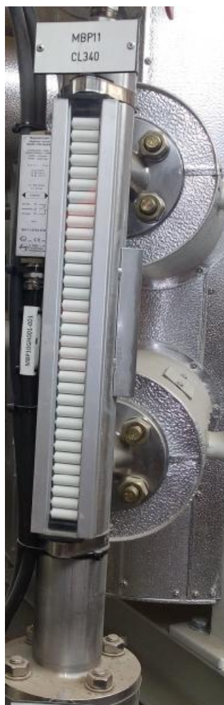
Рисунок 2 - Общий вид указателя уровня (фото)