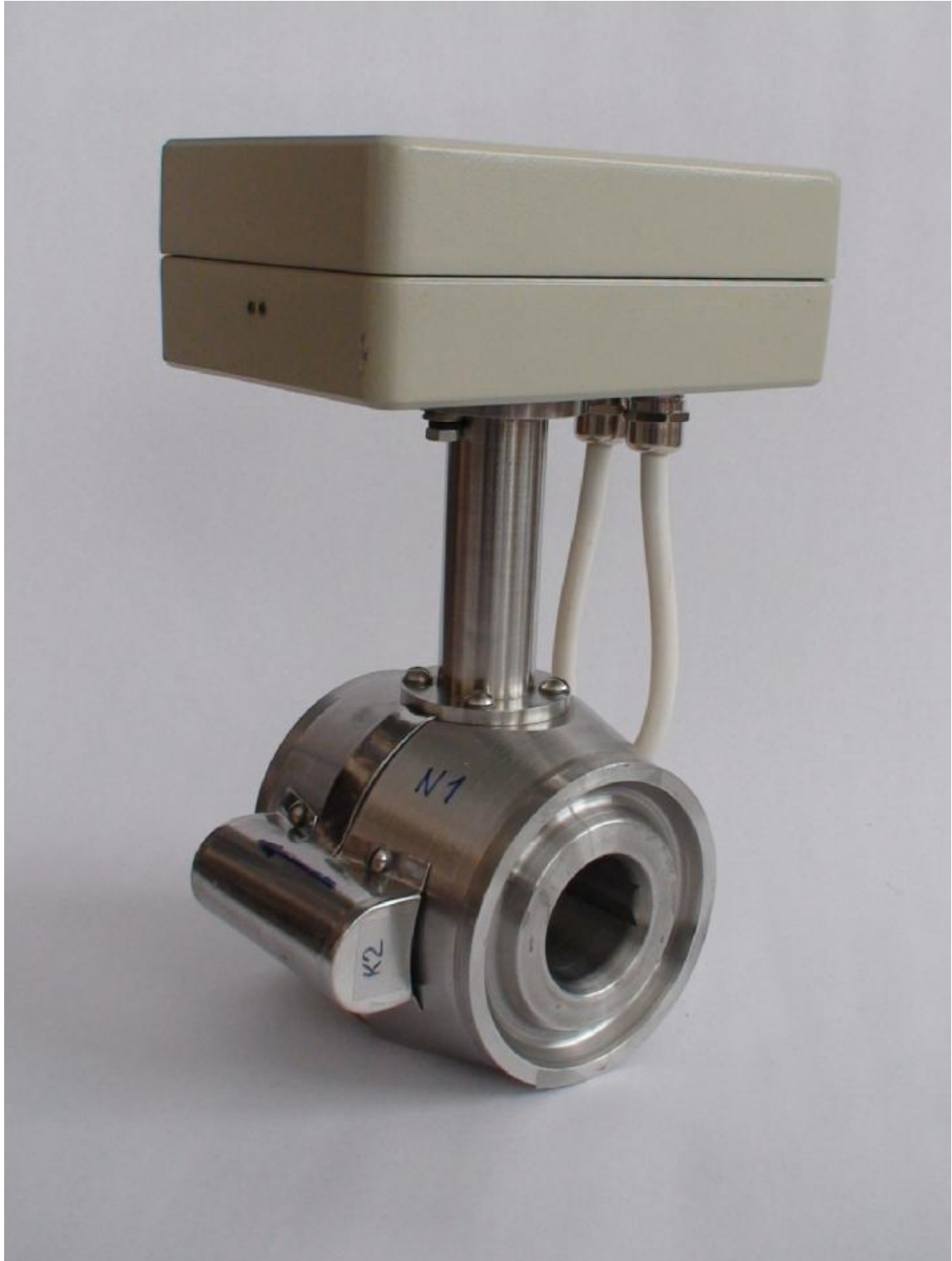
Рисунок 1 – Внешний вид расходомера

Внешний вид расходомера показан на рисунке 1.