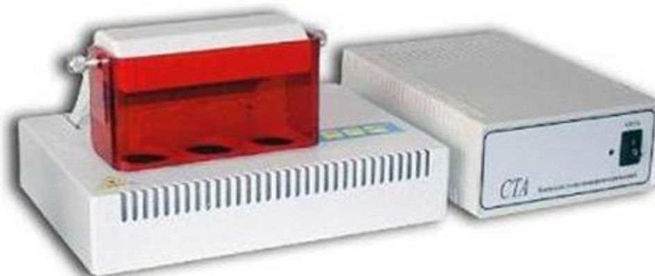
Рисунок 1 – Общий вид комплекса модификации СТА-3-УФ

Общий вид комплексов представлен на рисунках 1 и 2.