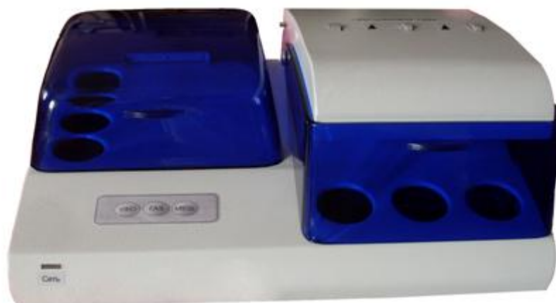
Рисунок 2 – Общий вид комплекса модификации СТА-М

Пломбирование комплексов для защиты от несанкционированного доступа осуществляется при помощи наклейки предприятия-изготовителя, наносимой на винты комплексов в соответствии с рисунками 3 и 4.