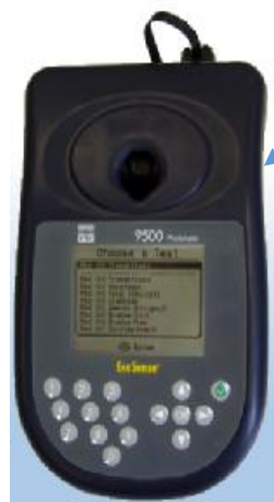
Рисунок 1 - Анализатор YSI. Вид спереди

Внешний вид анализатора представлен на рис. 1 и 2.