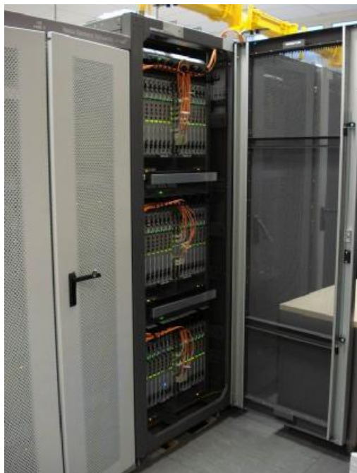
Рисунок 1- Общий вид оборудования с открытой дверью

Общий вид оборудования и место блокирования от несанкционированного доступа представлены на рисунках 1 и 2.