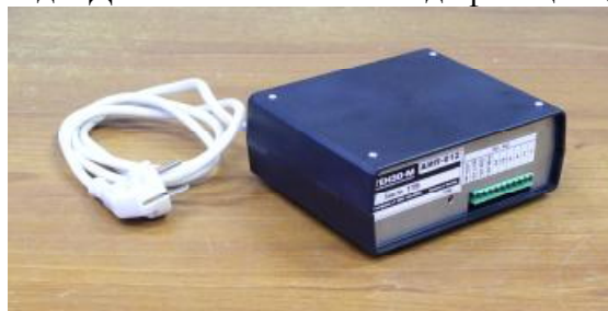
Рисунок 3 – Внешний вид АИП

Маркировка весов выполнена в виде таблички, закрепленной на ГПУ, и содержит следующие данные: