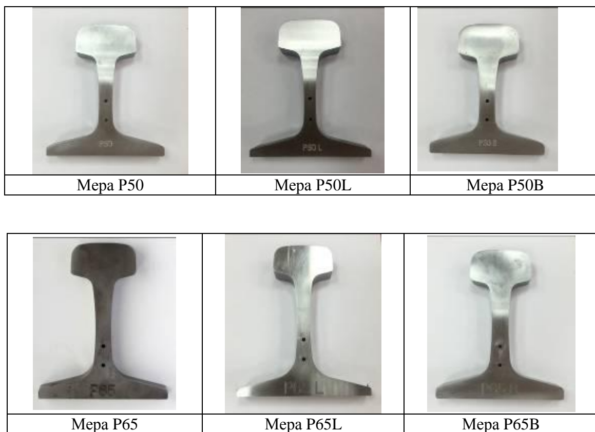
Рисунок 1 - Общий вид мер

На рисунке 1 показан общий вид мер, а на рисунке 2 – обозначение параметров профиля рельса.