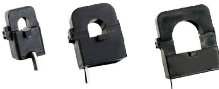
Рисунок 3 - Трансформаторы тока с разделяемым сердечником