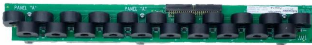
Рисунок 2 - Трансформаторы тока с неразделяемым сердечником на одной плате