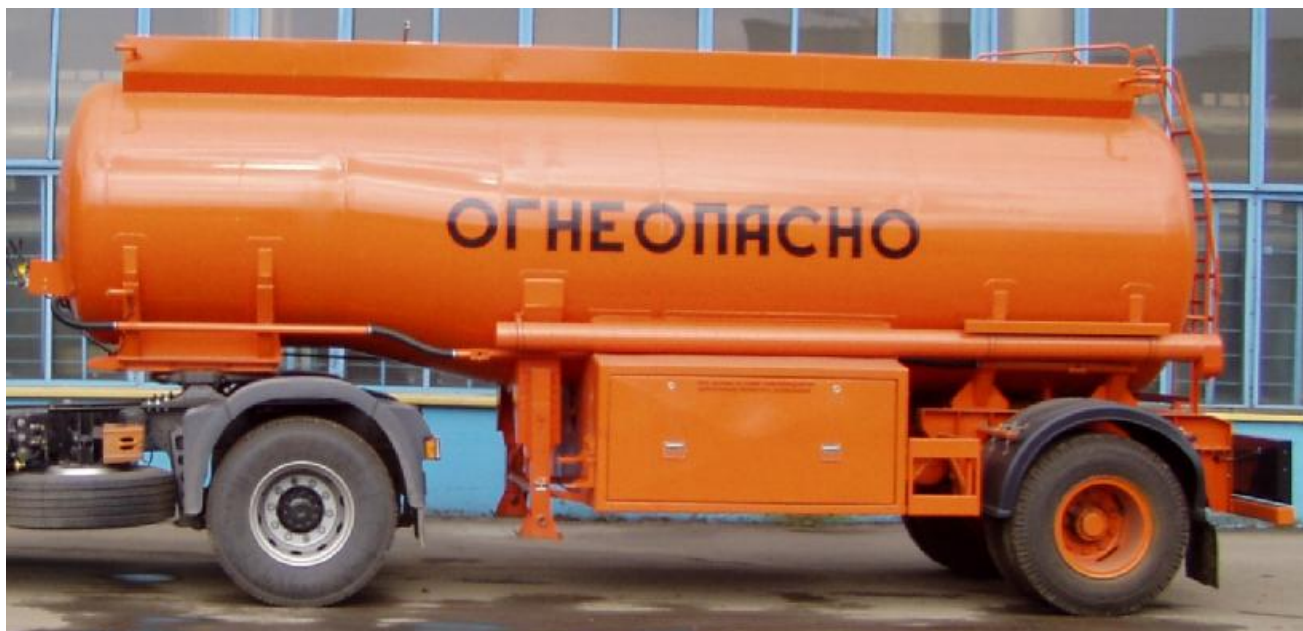
Фото 1 - Общий вид полуприцепа-цистерны БЦМ-48

На боковых сторонах и сзади ППЦ имеет надпись «ОГНЕОПАСНО», знак ограничения скорости и знаки с информационными табличками для обозначения транспортного средства, перевозящего опасный груз.