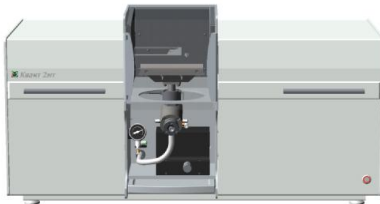
Рисунок 1 – Общий вид Спектрометра атомно-абсорбционного «Квант-2мт»

Конструктивно спектрометр выполнен в металлическом корпусе по блочной схеме на усиленном основании. Модели «Квант-2мт» и «Квант-2м1» имеют различия только в исполнении лампового отсека. Держатель ламп модели «Квант-2мт» выполнен в виде турели, а в модели «Квант-2м1» держатель выполнен в виде одинарной панели спектральной лампы. Общий вид прибора показан на рис.1.