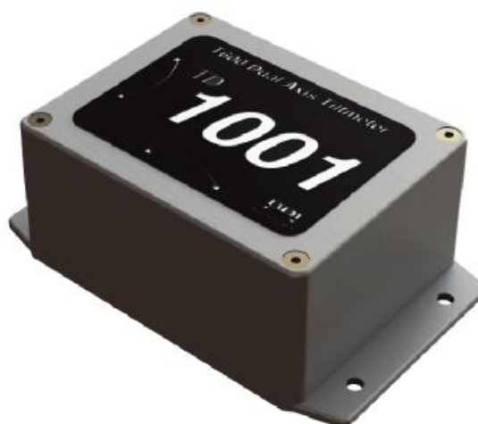
Рисунок 1 - Общий вид датчиков угла наклона BDI-T-410 и BDI-T-420

Общий вид датчиков угла наклона BDI-T представлен на рис. 1. и рис. 2