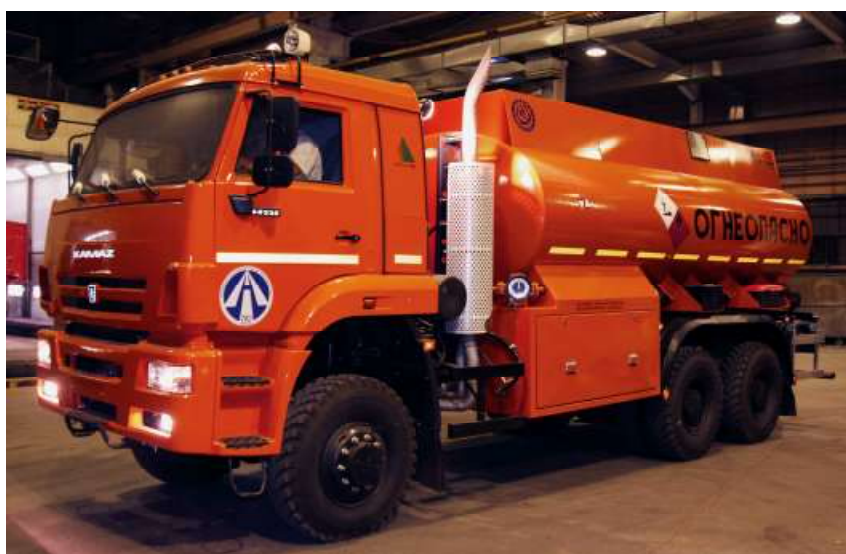
Рисунок 4 - Внешний вид автотопливозаправщиков БЦМ-229.4