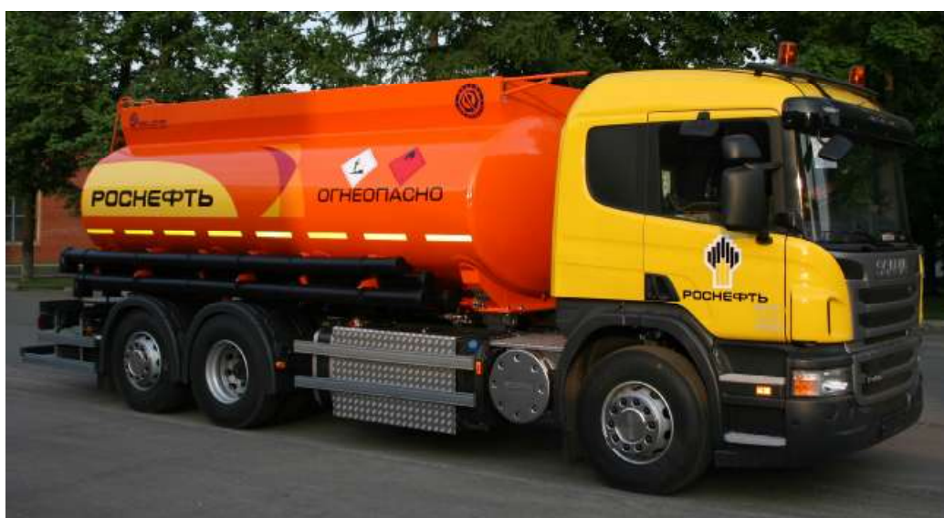
Рисунок 1 - Внешний вид автоцистерн БЦМ-229

Места пломбирования элементов конструкции цистерны для защиты от несанкционированного доступа к перевозимому (храняемому) нефтепродукту обозначены на рисунках № 5, 6.