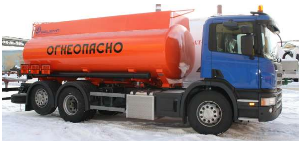
Рисунок 2 - Внешний вид автоцистерн БЦМ-229.2