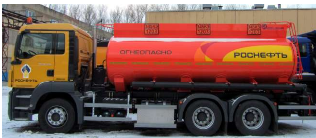
Рисунок 3 - Внешний вид автоцистерн БЦМ-229.3