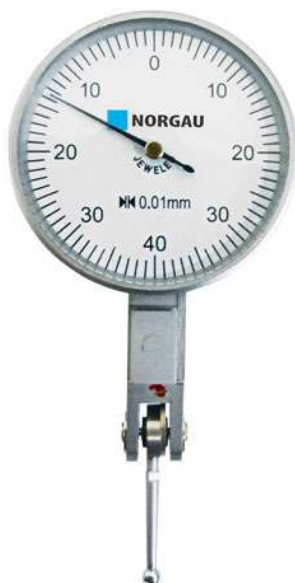
Рисунок 2 - Общий вид индикаторов серии 042 083 с ценой деления шкалы 0,01 мм