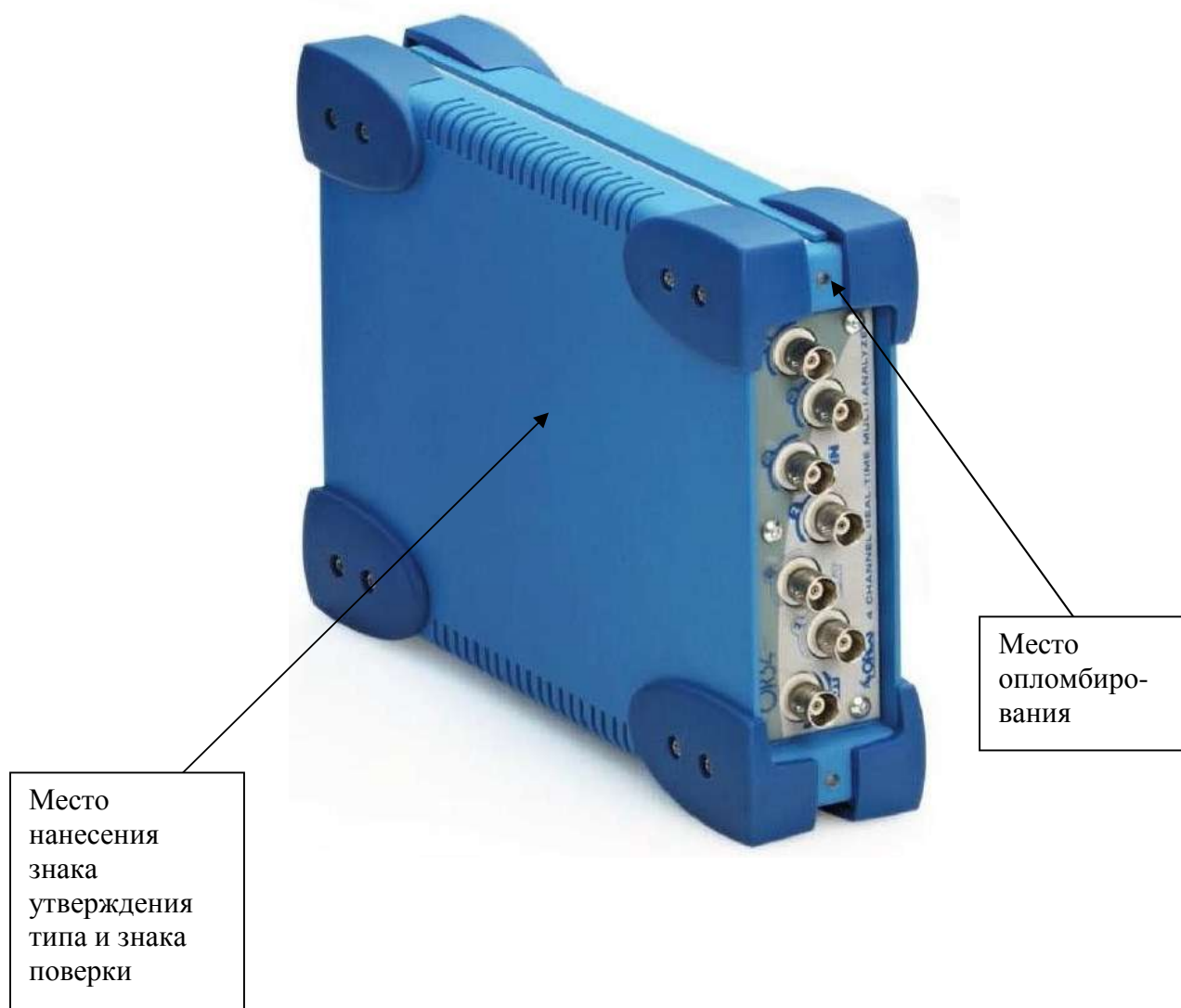
Рисунок 1 - Внешний вид анализатора OR34