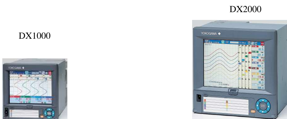
Рисунок 1 - Общий вид регистраторов