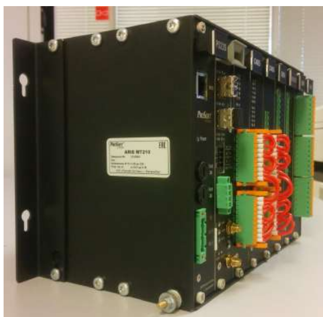
Рисунок 1 - Общий вид контроллера ARIS MT210

Фотография общего вида контроллера приведена на рисунке 1. Знак поверки в виде наклейки наносят на поверхность корпуса контроллера, как показано на рисунке 2. Для защиты от несанкционированного доступа контроллер опечатывают пломбами, как показано на рисунке 3.