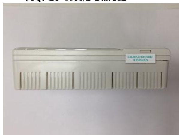
Рис. 6. Место для пломбирования и нанесения знака поверки сигнализаторов JTQJ-BF-6618/B, JTQJ-BF-6618/B BaltGaz