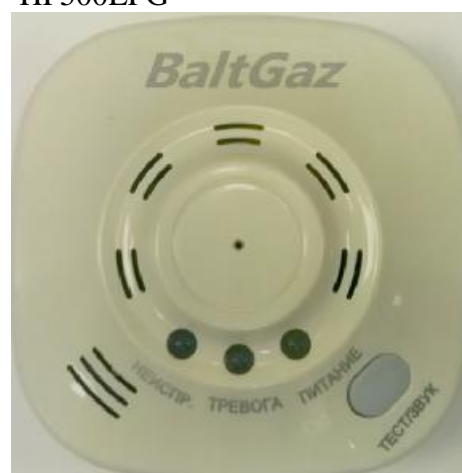
Рис. 4. Общий вид сигнализаторов JTQJ-BF-6618/B BaltGaz