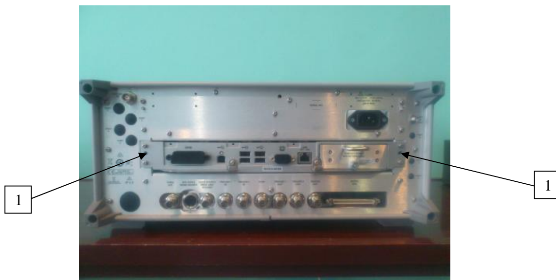
1 – место пломбировки (фирменной наклейки) от несанкционированного доступа