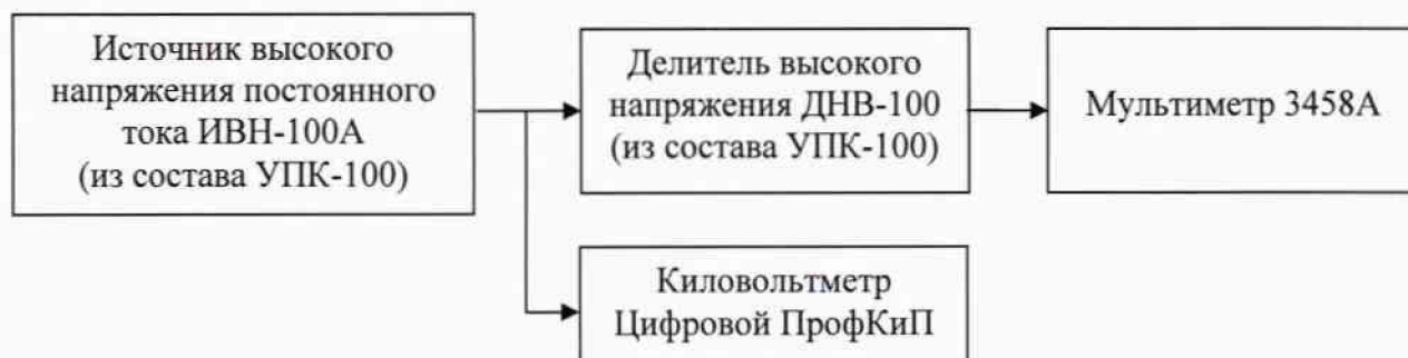
Рисунок 2 – Структурная схема подключения приборов для определения относительной погрешности измерения напряжения постоянного тока

– с помощью источника высокого напряжения ИВН-100А по мультиметру 3458А последовательно устанавливают значения напряжения постоянного тока, соответствующие: 2 кВ, 4 кВ, 6 кВ, 8 кВ, 12 кВ, 15 кВ, 20 кВ, 25 кВ, 30 кВ, 35 кВ, 40 кВ (для киловольтметра ПрофКиП С196М); 2 кВ, 4 кВ, 6 кВ, 8 кВ, 12 кВ, 20 кВ, 40 кВ, 50 кВ (для киловольтметра ПрофКиП С197М) и 2 кВ, 5 кВ, 10 кВ, 15 кВ, 20 кВ, 30 кВ, 40 кВ, 50 кВ, 60 кВ, 70 кВ, 80 кВ, 90 кВ, 100 кВ (для киловольтметра ПрофКиП С100М);