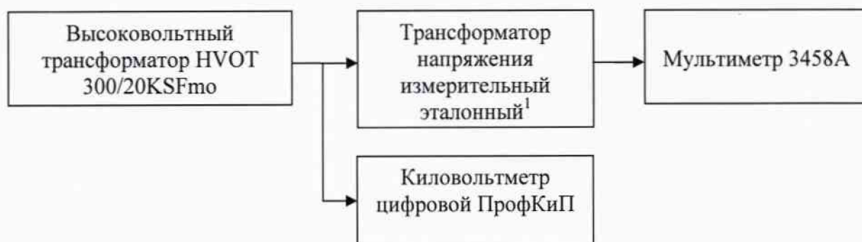
Рисунок 1 – Структурная схема подключения приборов для определения относительной погрешности измерения среднеквадратических значений напряжения переменного тока синусоидальной формы частотой 50 Гц.