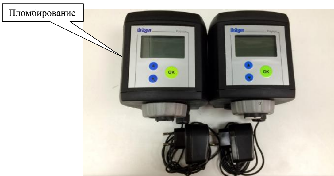
Рисунок 2 - Датчики контроля стабильности Dräger Polytron 7000 (с сенсорами Hydrazin и NO 2 )